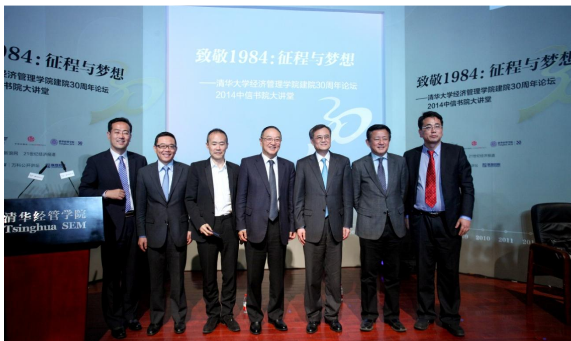
致敬 1984：征程与梦想——清华经管学院企业家论坛参会嘉宾合影（左起：曲向东、王斌、王石、柳传志、钱颖一、樊纲、陈劲）

后，它们已成长为中国商业界的中坚力量，并在各自行业内取得领袖地位。1984年，同时也是清华大学经济管理学院初创之年。本次论坛围绕“致敬1984”，输出了大量的企业经营管理经验与反思，也回顾了中国经济改革与发展30年的曲折经历，为观众生动立体地展现了中国经济社会和企业30年的风云变化。（供稿：高管培训中心 通讯员：罗晓铭 责编：张勇峰）