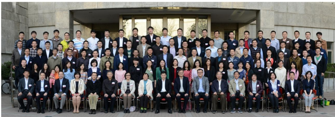
学院本科校友会成立大会合影

成立大会结束后，与会的老师、校友在清华经管学院伟伦楼前合影留念。（供稿：清华经管学院本科校友会、校友办 通讯员：张哲 责编：王万忻）