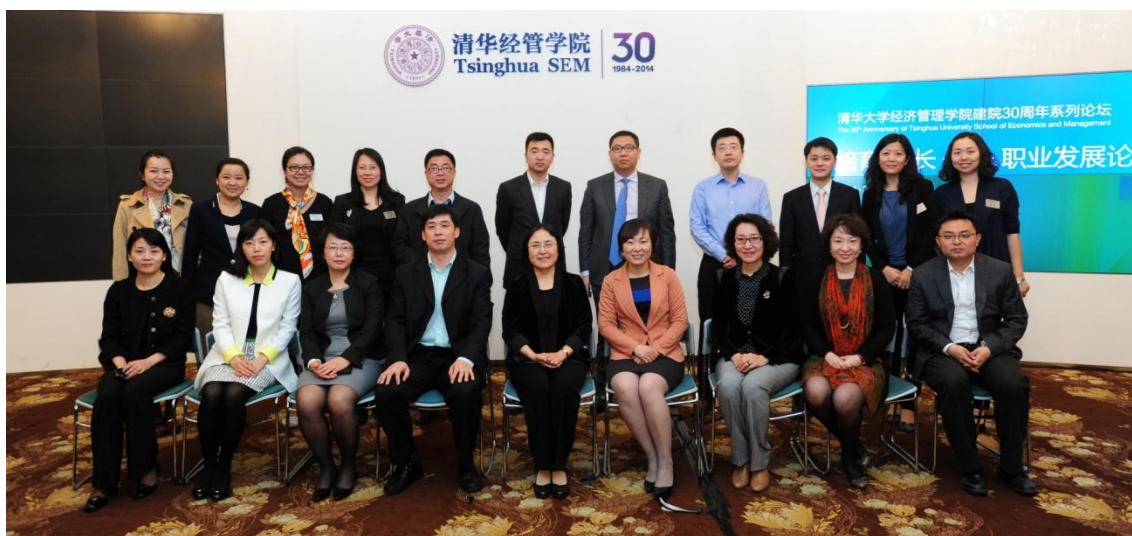
3月29日，培育·成长——职业发展论坛现场合影

此次论坛增进了学院与雇主之间的沟通和交流，传播了清华经管学院的教育理念。商学院的教育不仅是传授知识、培养能力，更要塑造品格，传承“自强不息、厚德载物”的精神，实现从“人才到领袖”的长远发展。（供稿：职业发展中心 责编：王宏）