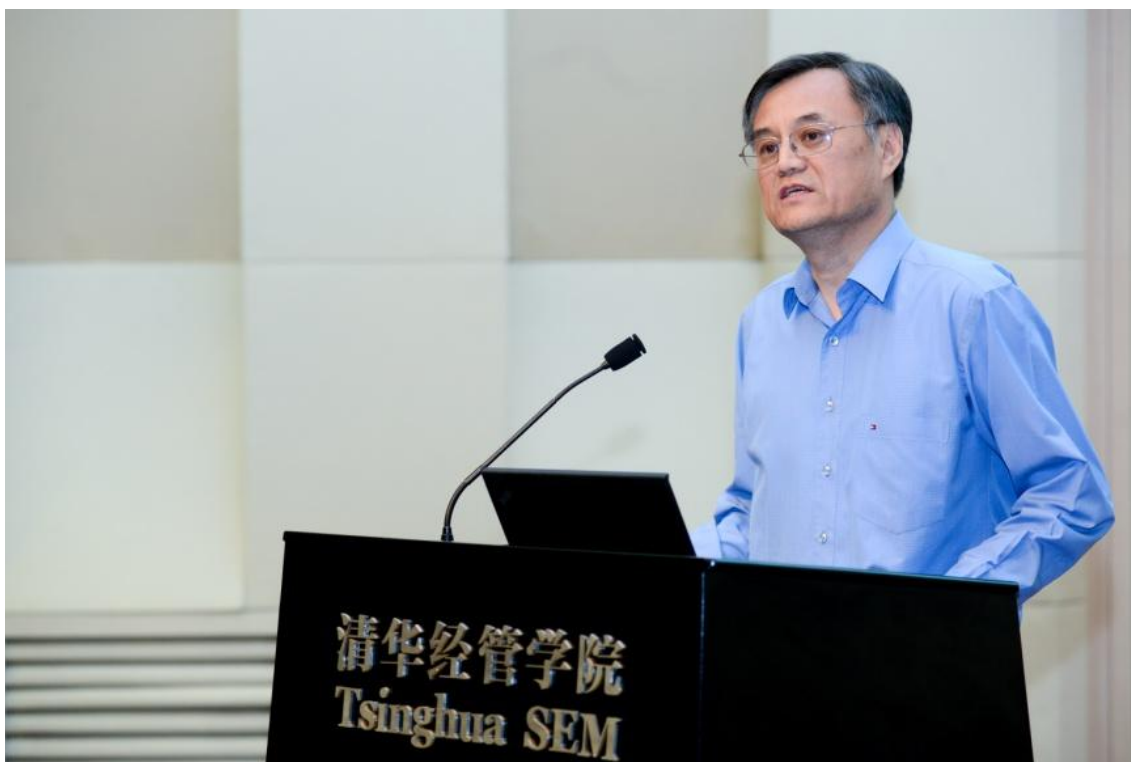
清华经管学院钱颖一教授对学院建院 30 周年系列活动和相关出版物进行了工作总结

大会首先播放了清华经管学院建院30周年系列活动的回顾视频。视频分为“呈现思想”、“感怀情谊”、“营造欢乐”、“共享荣耀”四个篇章，以照片形式回放了学院举办一系列活动的场面。