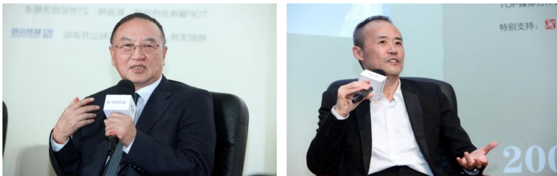
3月31日，柳传志、王石对话清华经管学院企业家论坛

在接下来的对话环节，联想控股集团董事长柳传志与清华经管学院杨斌教授就“市场的力量与卓越领导之道”进行主题对谈。柳传志以1984年联想成立至今所面临的社会政治经济形势的改变为主线，通过多个事例与大家分享了如何保障企业安全运行以及处理政商关系的智慧。万科企业股份有限公司董事长王石与清华经管学院院长助理陈劲教授就“创新创业：道路与梦想”的主题展开对话，王石为大家诠释了“病人比健康人更懂得什么是健康”这句格言背后的意义，并分享了自己参观无锡荣家梅园的思考与领悟，表达了对当时的一批中国企业家的敬意。他表示希望大家在学习西方先进文化的同时，深深汲取几千年来中国积淀下来的文化养分，成为既能在事业上成功又能为社会作出贡献的企业家。