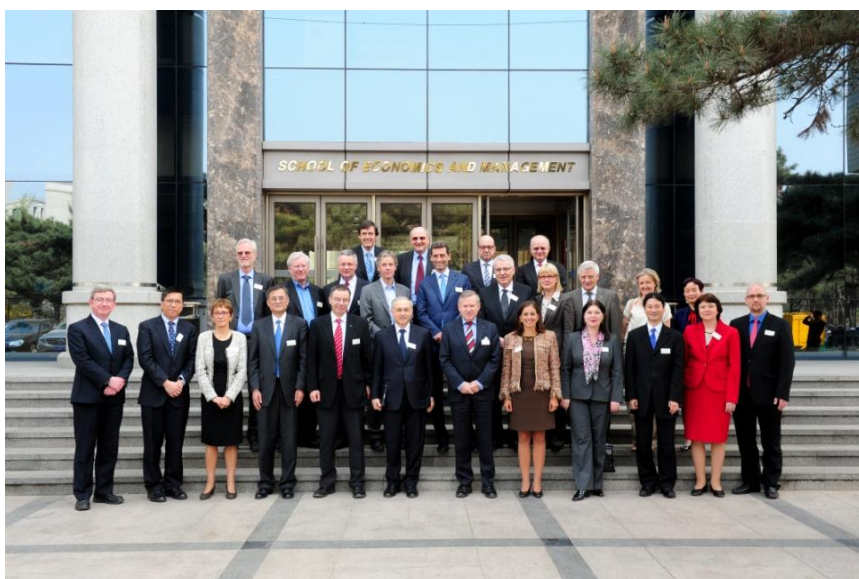
4月1日，管理硕士国际联盟（CEMS）战略委员会年会会后合影

2014年4月1日，来自欧洲、亚洲的20余位顶级商学院院长齐聚清华大学经济管理学院，围绕管理硕士国际联盟（CEMS）的发展战略和一系列相关问题进行讨论。CEMS 是一个汇集了全球顶尖商学院的联盟，战略委员会年会是 CEMS 最重要的年度活动之一，在促进成员学院之间的交流、互动和合作方面起到了重要作用。清华经管学院是 CEMS 在中国大陆的唯一成员，在学院建院30周年之际，承办了 CEMS 首次在亚洲召开的年会。