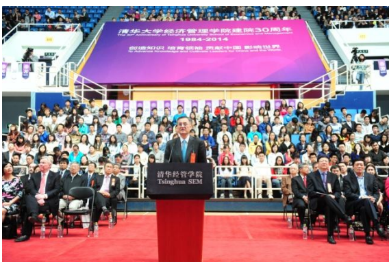
清华经管学院院长钱颖一