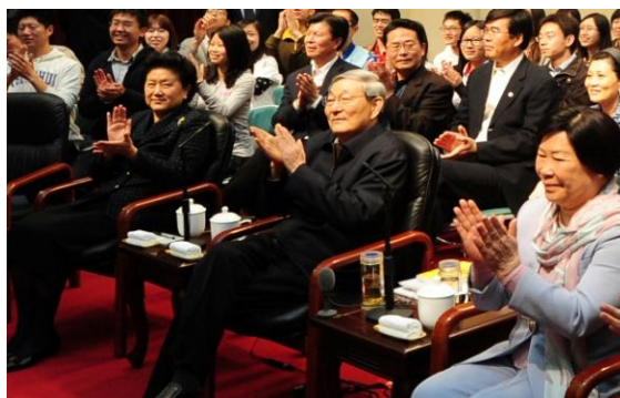
2011年4月22日，在清华大学百年校庆之际，朱镕基院长回到清华经管学院与师生进行亲切交谈，他说：“清华经管学院真是培养出了一代天骄，不是一个戴天骄，是一代天骄。”