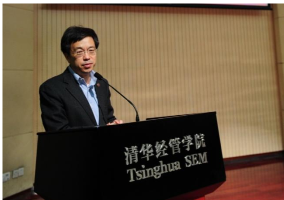
清华大学党委副书记史宗恺教授

随后，清华经管学院院长钱颖一教授致辞。他首先感谢各位校友从世界各个角落、从不同的岗位回到母校参加这个有特殊意义的活动，同时他还感谢来参加活动的学院老师。接着，他系统地回顾了学院本科教育的历史与沿革，以及近年来学院建立的按照教学项目组织的校友会。他细数了自1926年清华大学成立经济系以来本科项目的创新和发展，回顾了学院30年来筚路蓝缕，不断完善自身，适应全球化时代挑战的历程。钱颖一院长指出，近年来学院本科教育体系不断沿着“通识教育与个性发展相结合”的理念发展，把通识教育定位于价值塑造、能力培养、核心知识获取三位一体的教育，目的是培养同学们不仅成为一名专业人士，更要成为一名现代文明人。“个性发展”则是融合学生个性的发展和对学生个性化的培养。学院不断自我颠覆和完善，获得了广大师生和家长的认可。未来，学院将继续进行包括本科生招生体制改革在内的改革，用更加多元的人才