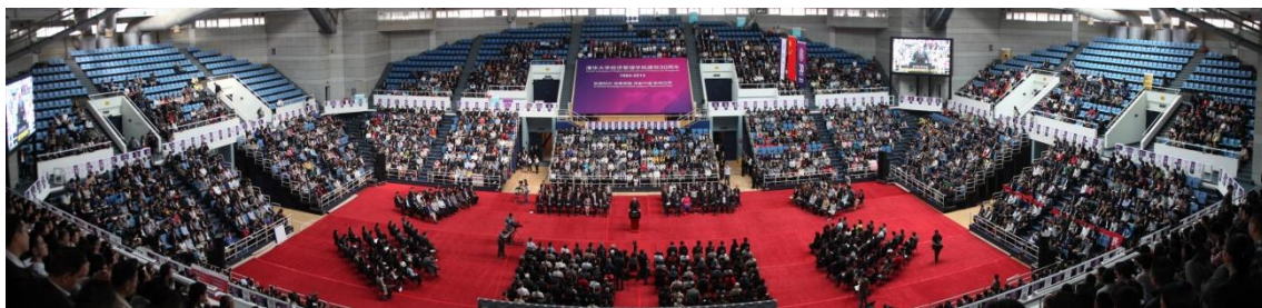
清华经管学院建院 30 周年师生校友重聚共叙活动现场

人才的首要职责；始终坚持走国际化的发展道路，努力建设世界一流的经济管理学院；始终把教育现代化作为学院办学的指导思想，不断改革创新教育模式和体制。钱颖一表示，清华经管学院将抓住机遇，顺势而上，为中国经济社会发展和全面深化教育改革做出贡献，创造更加值得期待的下一个十年、下一个三十年。