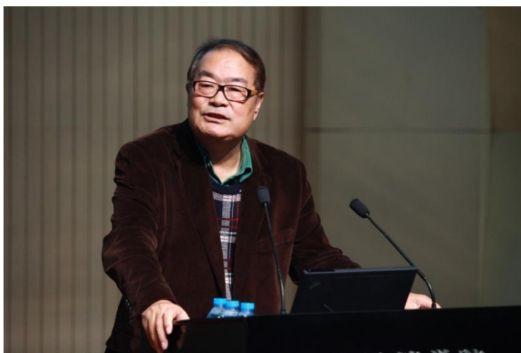
魏杰教授发表题为“中国产业结构调整的新趋势”的主题演讲

过去十年，商业社会创新和颠覆无处不在，竞争格局动荡成为常态。在中国本土市场，信息技术的发展和本地需求的逐渐升级，为全球企业提供了新的机会。新一轮的改革深化会释放企业创新的活力，也为现有的竞争格局的改变注入了新的动力。新时代的企业经营，在战略上仅仅依赖于资源获取不足以获得先机，唯有对产业格局的动态把握，主动创新才是在动荡年代应对颠覆、保持领先的关键。清华经管学院建院三十年来，秉承着“创造知识、培育领袖、贡献中国、影响世界”的使命，始终结合学术研究与实践探索，在中国产业变革、战略创新、技术经济学科体系的构建和创业型经济发展等多个领域取得卓越的成果。正值清华经管学院建院三十周年之际，由创新创业与战略系举办的“激荡年代的产业变局与战略创新”论坛，纵论产业格局的变化之势，分享新阶段、新格局下的战略创新之道，对学术研究和实践探索均具有指导意义和重要启示。