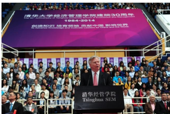
麻省理工学院斯隆管理学院院长施密特雷恩