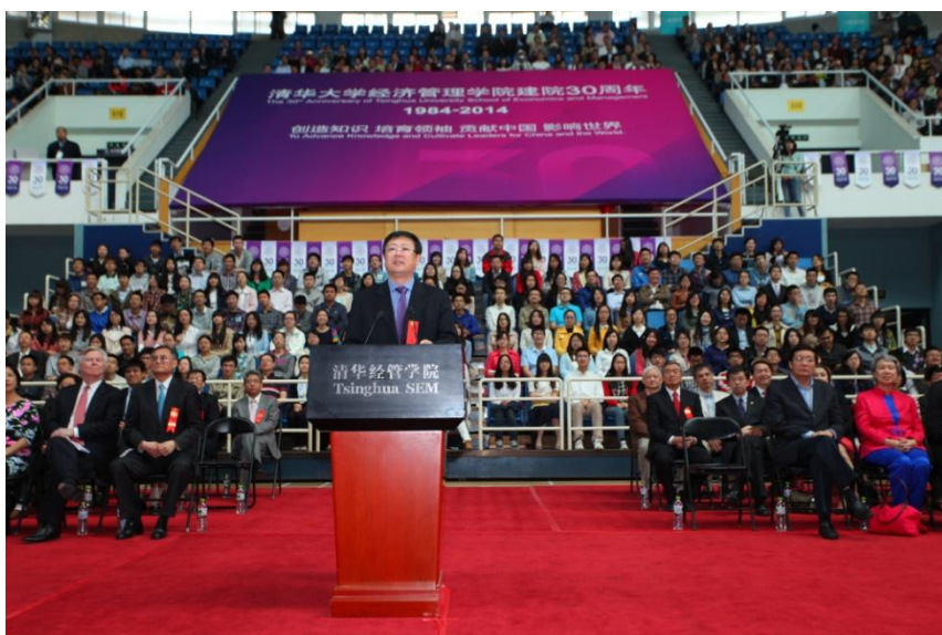
清华大学校长陈吉宁宣读朱镕基院长重要来信并讲话

陈吉宁在活动开始时宣读了朱镕基的来信。朱镕基在信中表示，三十年来，清华经管学院在清华大学的领导和支持下，全院同仁锐意改革，艰苦奋斗，已经成为国内一流、世界有名的经济管理学院，成果丰硕，他深感欣慰。朱镕基希望学院全体师生以“三十而立”之年为新的起点，坚持改革创新，自强不息，追求完美，尽快把清华经管学院建成世界一流的经济管理学院，为国家振兴培育出更多的优秀人才。