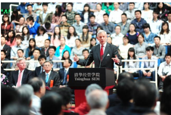
清华经管学院顾问委员会委员代表、麦肯锡董事长兼全球总裁鲍达民