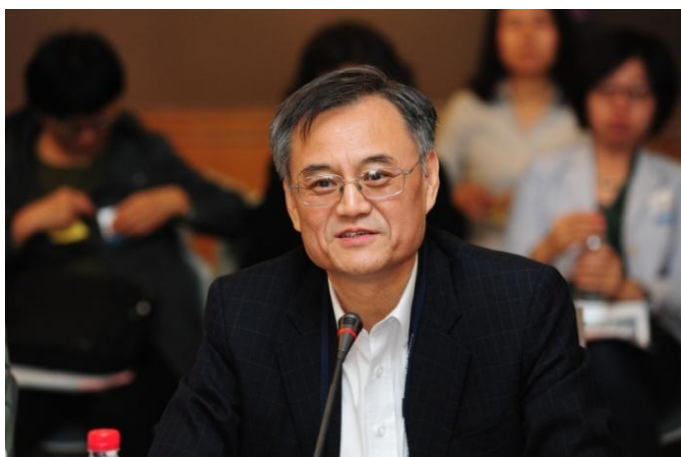
清华经管学院院长钱颖一教授