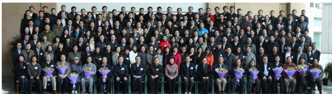
学院博士校友会成立大会合影

成立大会结束后，与会的老师、校友在清华经管学院舜德楼大厅合影留念。（供稿：校友办 通讯员：孔祥睿 责编：王万忻）