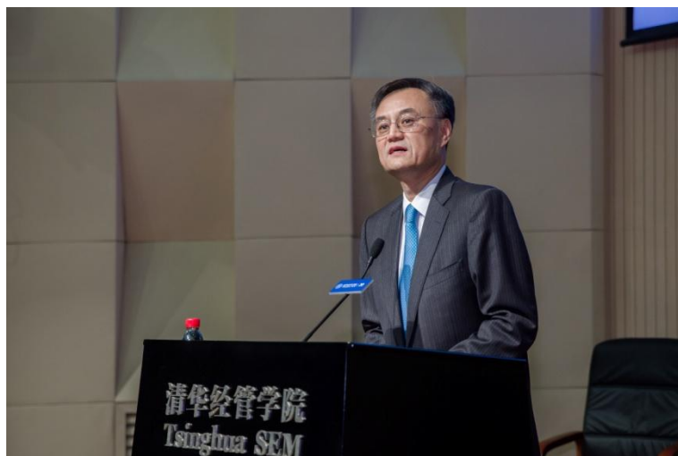
清华经管学院院长钱颖一教授致辞

钱颖一院长最后说：“中国的管理教育，伴随中国经济和企业的快速发展取得了卓越的成绩。中国的全面深化改革，日益加剧的全球化竞争，日新月异的技术变化，都对中国的管理教育提出新的挑战。我们任重道远。”