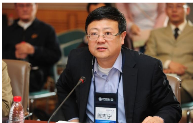
清华大学校长陈吉宁教授

清华大学经济管理学院钱颖一院长在致辞中首先对到会嘉宾表示了欢迎，并特别说明经管学院举办本次论坛，源于学院对本科教育的重视和对本科教育改革的探索，更是希望从论坛中学习并改进自身的工作。他简要回顾了近年来学院本科教育改革的历程。从2002年开始大平台招生和培养，从2007年开始加大招生力度并大幅提高英语授课和学生海外交换学习，从2009年全面实施“通识教育与个性发展相结合”的改革方案。2009年学校把经管学院列为本科教育改革试点学院。