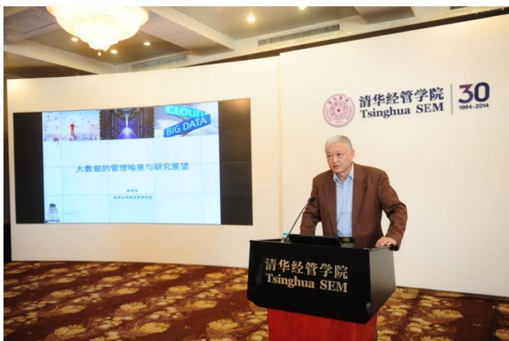
陈国青教授发表题为“大数据的管理喻意与研究展望”的主题演讲

清华经管学院院长钱颖一教授向来宾们介绍了学院建院30周年系列活动的情况，管理科学与工程系系主任、联想讲席教授陈剑致欢迎辞。本次活动在信息领域资深专家陈国青教授关于“大数据的管理喻意与研究展望”的主题演讲中正式开始，陈教授从信息技术沿革引出大数据的基本特征，指出大数据的超规模、多样性、低价值密度、实时性四方面特征，带来了“IT融合”、“内外部融合”、“价值融合”等三大融合；随着信息产品（如软件、IT服务等）及其应用（如虚拟体验、个性推荐、社会网络、网络搜索等），技术创新呈现出越来越丰富的形态和特征，催生出“新模式”（如线上线下互动的O2O（online-to-offline 或 offline-to-online）运作模式）、“新业态”（如众包（crowdsourcing）生产和创新组织）、“新人群”（如生活在赛博空间中的人群及其行为和需求）等，并对相关研究进行展望，指出未来学术界与业界将围绕“社会化的价值创造”、“网络化的企业运作”和“实时化的市场洞察”三方面展开。