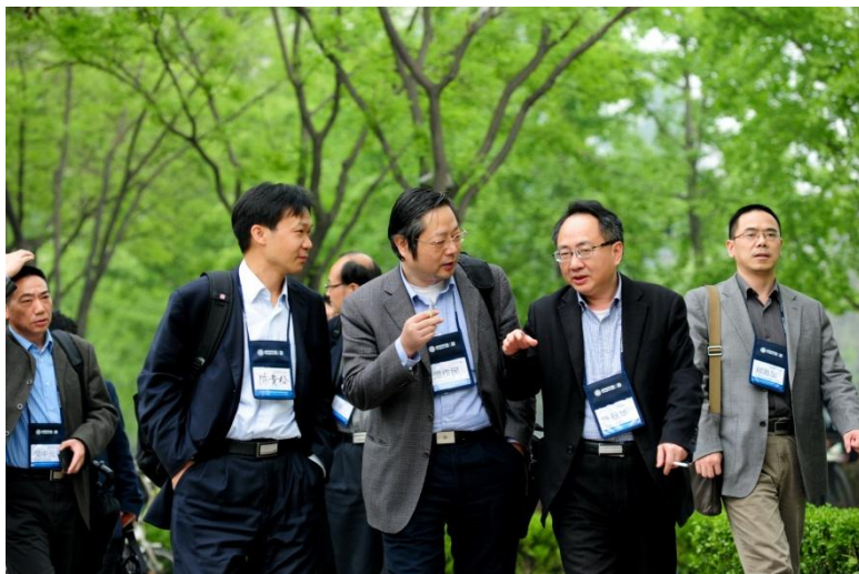
4月18日~19日，管理学院院长齐聚清华经管学院，分享交流办学经验

“思想·引领”系列学术论坛分别由清华经管学院会计系、经济系、金融系、创新创业与战略系、领导力与组织管理系、管理科学与工程系、市场营销系七个系主办，论坛邀请业界专家与学院教授就当前关注的主题展开讨论。论坛将学术研究与经济实践、管理实践相结合，既体现学术水平，也联合实际应用。