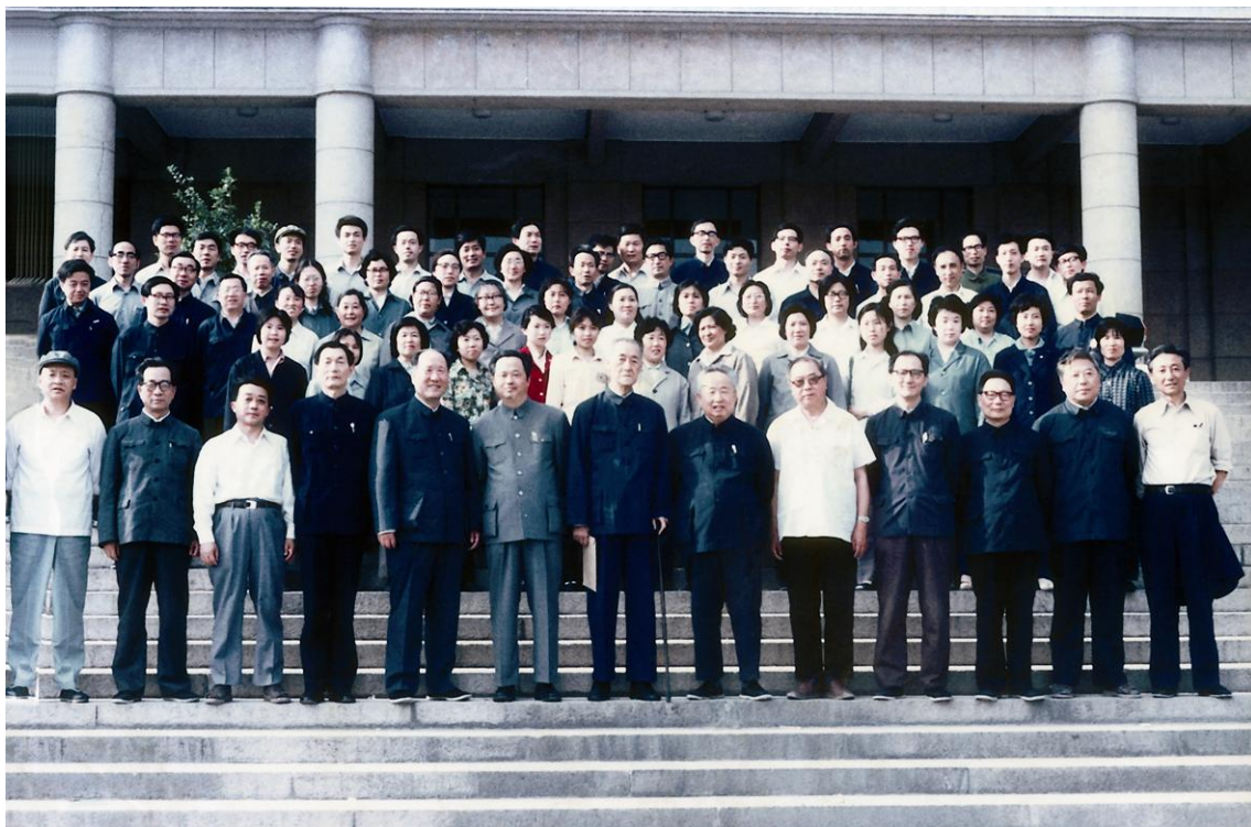
1984年5月19日，清华大学经济管理学院成立大会在清华大学主楼举行。成立大会后，朱镕基院长（前排左四）与学院教职员在主楼前合影。

以上这四条：建设世界一流学院、把教师作为根本推动力、为人重于为学以及追求完美是朱镕基院长为清华经管学院指明的道路，同时也抓住了中国高等教育的核心问题。学院一直围绕这些方面在努力实践。