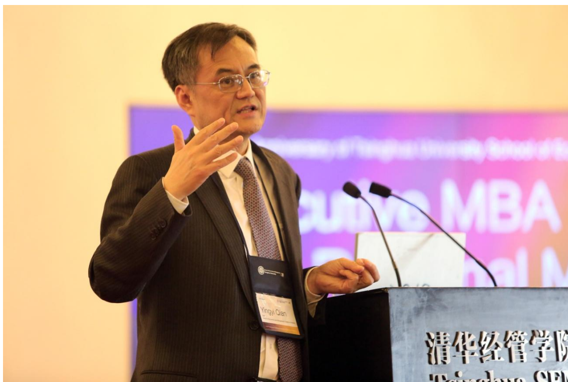
清华经管学院院长钱颖一教授作题为“中国 EMBA 教育：特色与创新”的演讲

2014年4月15日~16日，全球 EMBA 理事会亚洲区域会议继2004年第一次在清华大学经济管理学院召开之后，相隔十年再次在学院召开。本届大会的主题是“亚洲（中国）EMBA 发展面临的机遇、问题与挑战”。亚洲三十余个 EMBA 项目所在学院院长以及项目负责人共计五十余人参与本次大会。除国内顶尖商学院参会以外，国际知名商学院也积极参与此次会议，例如，美国西北大学凯洛格管理学院、芝加哥大学布斯商学院、宾夕法尼亚大学沃顿商学院以及哈佛商学院等。