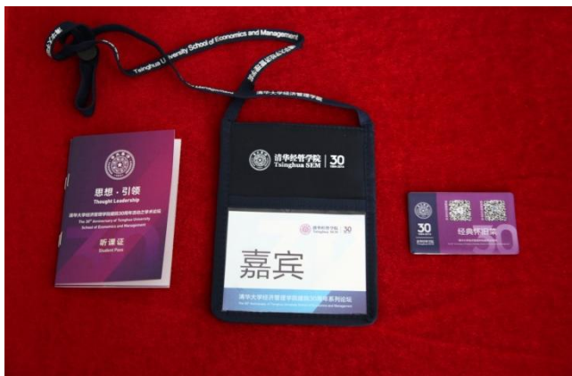
独具创意的“听课证”、嘉宾胸牌和冰箱贴

不仅仅是“经典怀旧菜”午餐，几乎所有的活动都有创意思想的影子。比如，学院为“思想·引领”系列学术论坛设计了电子票并借助新媒体微信进行发放；学院还为此设计了精美的“听课证”，每听完一场学术论坛大家都能为自己的“听课证”集到一个特别设计的学术章。再比如学院为论坛活动设计制作的参会嘉宾胸牌，在满足设计美感的同时，更具实用性。又比如，学院为“经典怀旧菜”午餐设计了一款“冰箱贴”，上面除了有学院建院30周年的标识之外，还有学院和校友微信公共平台的二维码。