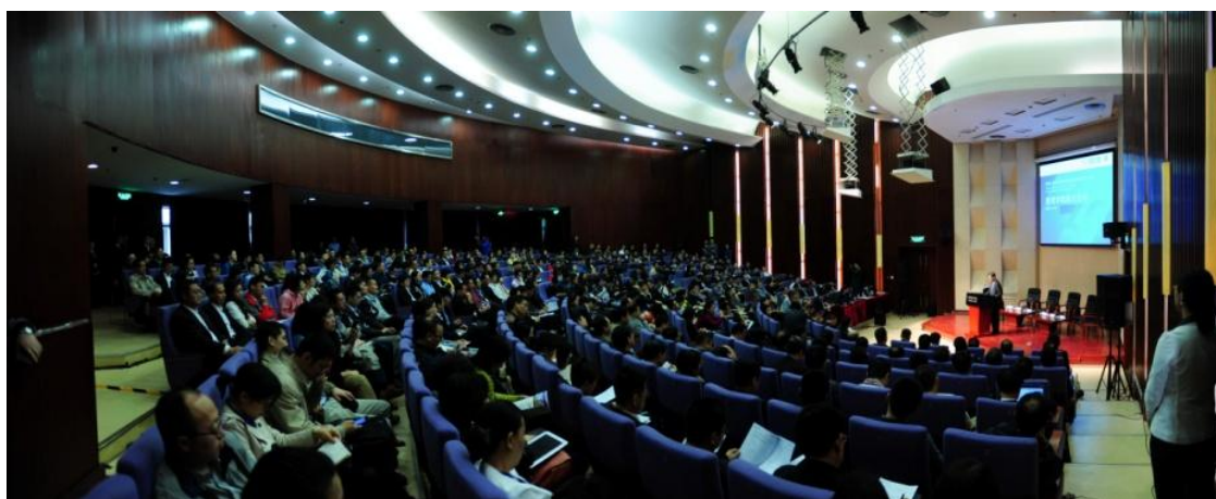
4月19日，管理学院院长论坛现场

球化经济是主要方向。长江商学院创办院长项兵教授探讨了该学院多项创新突破：管理教育引入人文课程、针对董事长总经理进行系列课程的创新、和而不同的人才培养观、全球视野、社会责任、双向交流、后 EMBA 课程。上海交通大学安泰经济与管理学院院长周林教授则介绍了该学院优势项目的发展历程。清华经管学院院长钱颖一教授把新焦点放在创新创业教育上，并介绍了过去一年学院的三项行动：第一，把创新创业的理念拓展，增加了创意；第二，组建了创新创业与战略系，充实了教师队伍；第三，创建了清华 x-lab（清华 x-空间），定位于面向所有清华学生、校友、教师的创意创新创业的教育平台，由经管学院发起牵头联合14所院系共同打造。创建一周年之际，已有200多个项目进入清华 x-lab，50余家公司注册，融资逾3000万元，发展势头迅猛。