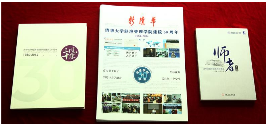
建院30周年期间出版的《三十风采》画册、《新清华》经管学院建院30周年专刊、再版的《师者——清华经管学院教授访谈录》文集

清华经管学院在建院30周年之际，出版了《新清华》经管学院建院30周年专刊，《三十风采》纪念画册，再版了《师者——清华经管学院教授访谈录》文集，这些出版物从不同角度总结回顾了清华经管学院建院30年来，特别是近10年来的历程。