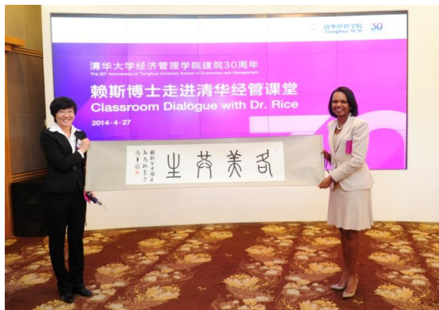
高尚毓同学（经2009/经硕2013）向赖斯博士赠送她的书法作品“各美共生”