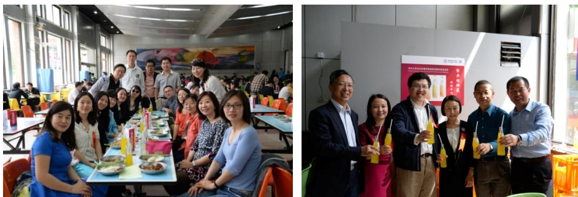
师生校友共品“经典怀旧菜”午餐

2014年4月26日，清华经管学院迎来了三十周岁的生日。来自国内外的经管校友怀着喜悦的心情重聚共叙，回顾学院十年风雨、二十风华、三十风采的发展历程。为了满足校友们怀旧的心愿，学院在十食堂（现称“听涛园”）和万人食堂（现称“观畴园”）安排校友们品尝“经典怀旧菜”午餐。