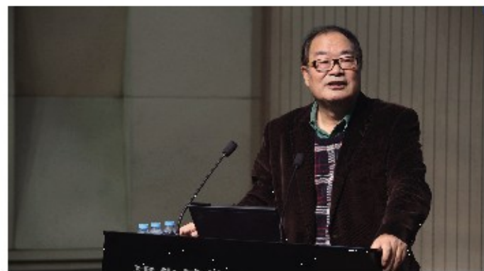
创新创业与战略系主办的“激荡年代的产业变局与战略创新”主题论坛中,清华同方讲席教授魏杰发表主旨演讲。