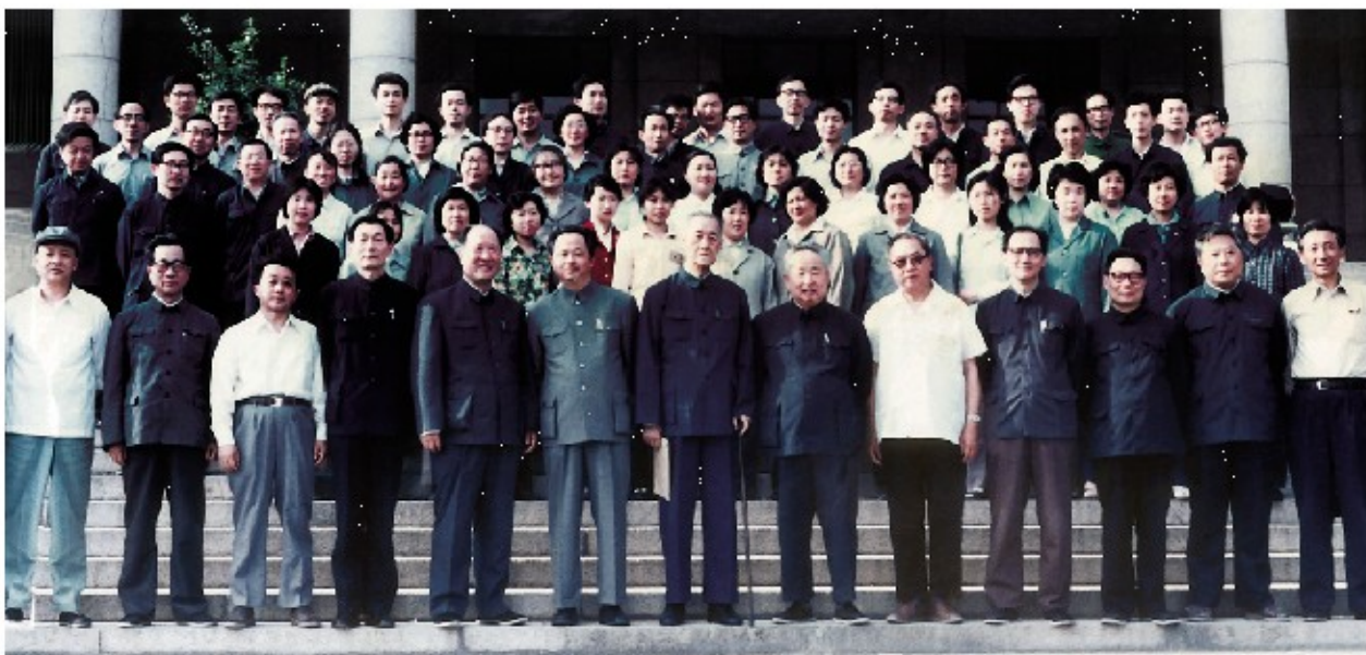
1984年5月19日,清华大学经济管理学院成立大会在清华大学主楼举行。成立大会后,朱镕基院长(前排左四)与学院教职员工在主楼前合影。

以上这四条:建设世界一流学院、把教师作为根本推动力、为人重于为学以及追求完美是朱镕基院长为清华经管学院指明的发展道路,同时也抓住了中国高等教育的核心问题。学院一直围绕这些方面在努力实践。