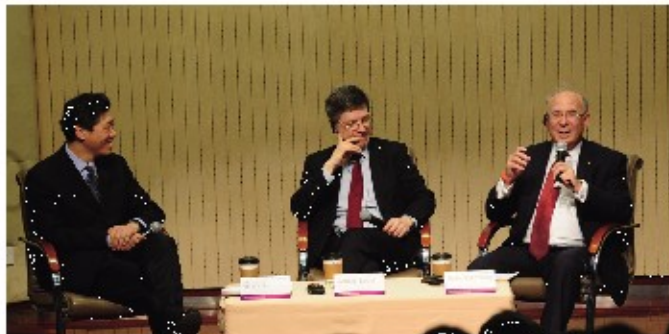
金融系主办的“金融体制改革——提升资源配置效率”主题论坛中,弗里曼讲席教授李稻葵(左一)对话世界著名经济学家杰弗里·萨克斯(左二)、摩根大通国际董事长雅各布·弗兰克尔(右一)。