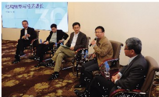
经济系主办的“结构转型与经济增长”主题论坛中,经管学院教授与校友嘉宾展开讨论。