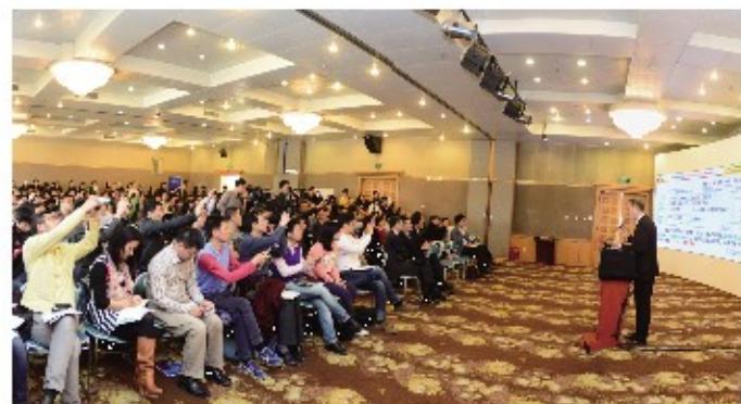
市场营销系主办的“大数据时代的商业模式创新”主题论坛吸引了200多名观众,现场气氛热烈。