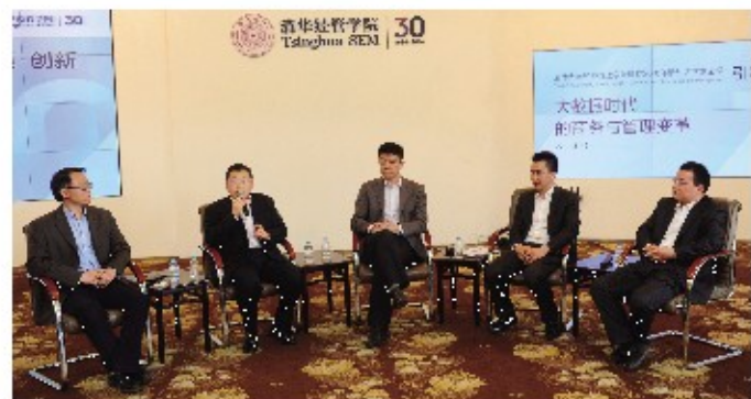
管理科学与工程系主办的“大数据时代的商务与管理变革”主题论坛中,校友嘉宾分享了各自企业运用大数据的实例。