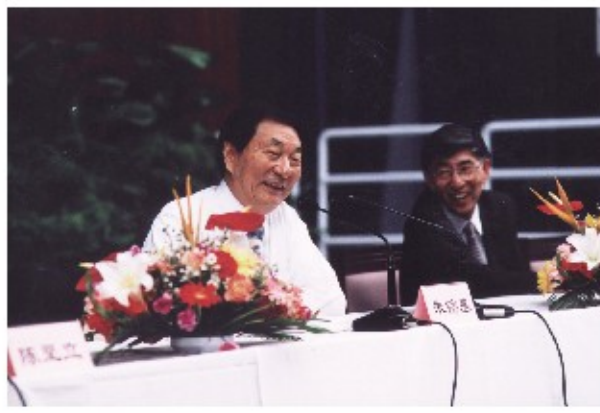
2001年6月5日,朱镕基院长辞去清华经管学院院长职务,在他的演讲过程中,老师们、同学们一次又一次地用掌声表达着内心深处对这位在任17年的院长的爱戴。