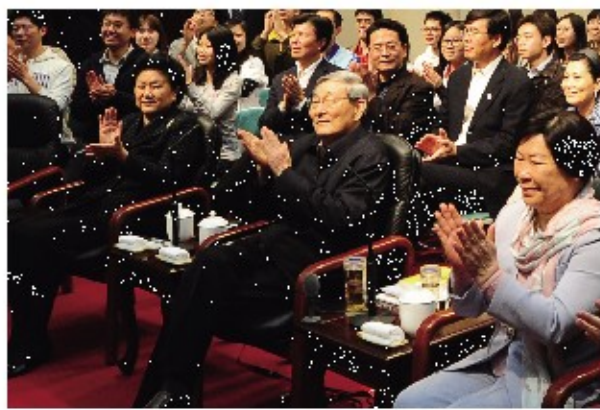
2011年4月22日,在清华大学百年校庆之际,朱镕基院长回到清华经管学院与师生进行亲切交谈,他说:“清华经管学院真是培养出了一代天骄,不是一个戴天骄,是一代天骄。”