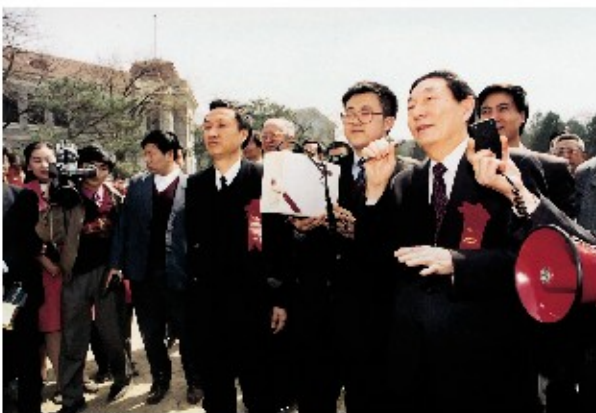
1994年3月30日,清华经管学院建院10周年,朱镕基院长在跟大家拍完大合影欲离去时突然转身,对同学们语重心长地说:“你们每个人搞好一个企业,中国经济就有希望了。”从此这句话成为许多清华经管人的座右铭。